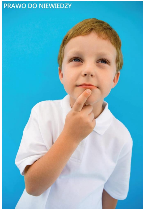
PRAWO DO NIEWIEDZY