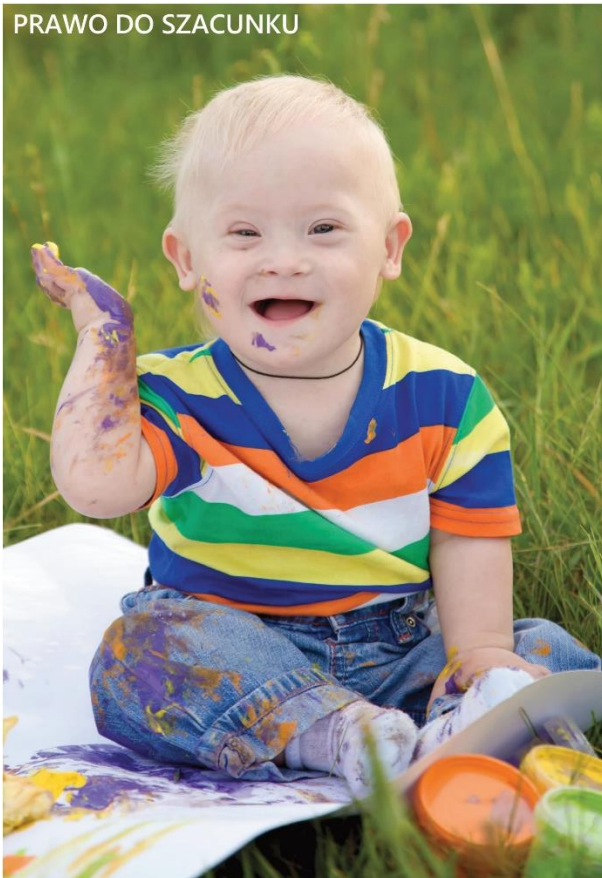
PRAWO DO SZACUNKU