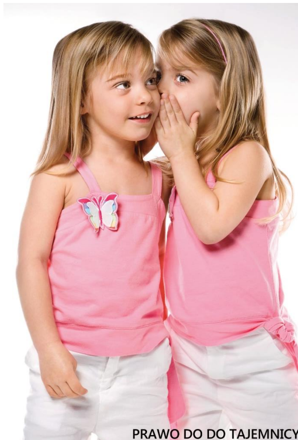
PRAWO DO DO TAJEMNICY