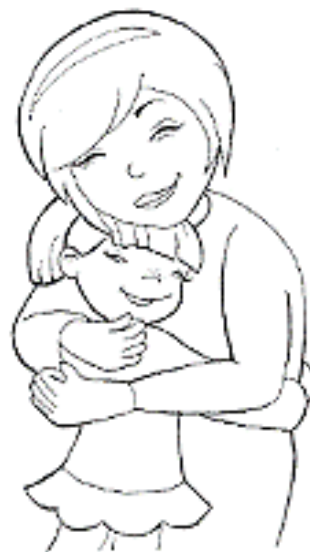
PRAWO DO MIŁOŚCI