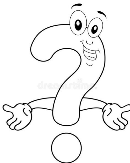
PRAWO DO NIEWIEDZY

6. Moje obowiązki- każdy z nas oprócz praw ma również obowiązki, które należy wypełniać, żebyśmy mogli wspólnie dobrze i zgodnie żyć.