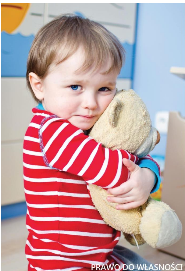
PRAWO DO WŁASNOŚCI