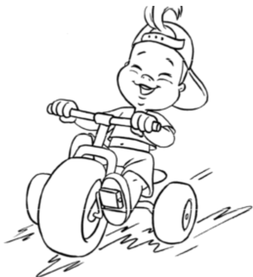
PRAWO DO RADOŚCI

5. Moje prawa- kolorowanka. Pokoloruj ilustracje, które przedstawiają prawa dziecka i powieś je w domu w widocznym miejscu.