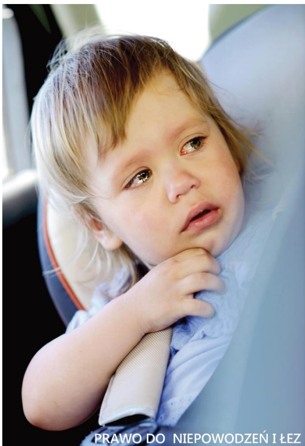
PRAWO DO NIEPOWODZEŃ I ŁEZ